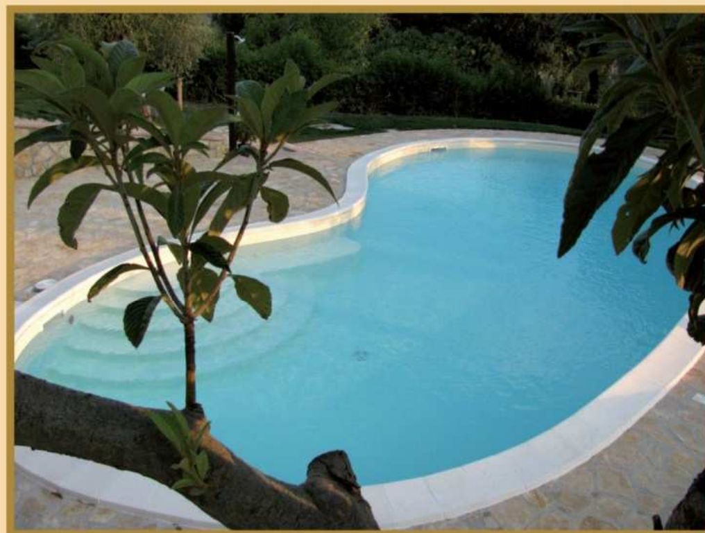
Dimora di Gemma

A pool located in one of the gardens of Villa Rancio is available to the guests and surrounded by secular olive trees.